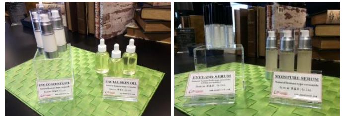
展示予定の天然ヒト型セラミドを使った化粧品サンプル

このたび(株)ジェヌインR&Dが、天然資源からの抽出精製に世界で初めて成功した天然ヒト型セラミドは、ヒト角質層に存在するセラミドに相当する画期的なものです。