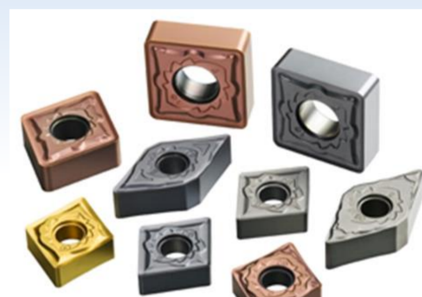
インサートチップの一例