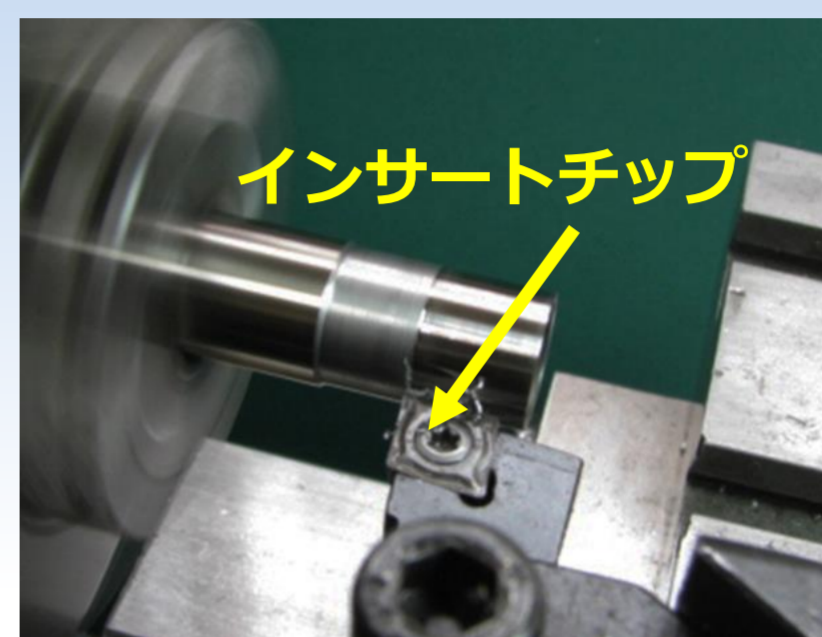
インサートチップの使用状況