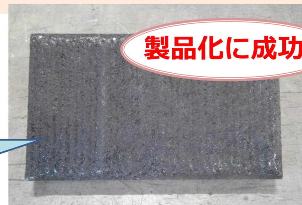
サーメット破碎粒を溶接した耐摩耗鋼板