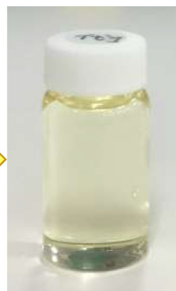
リサイクル絶縁油