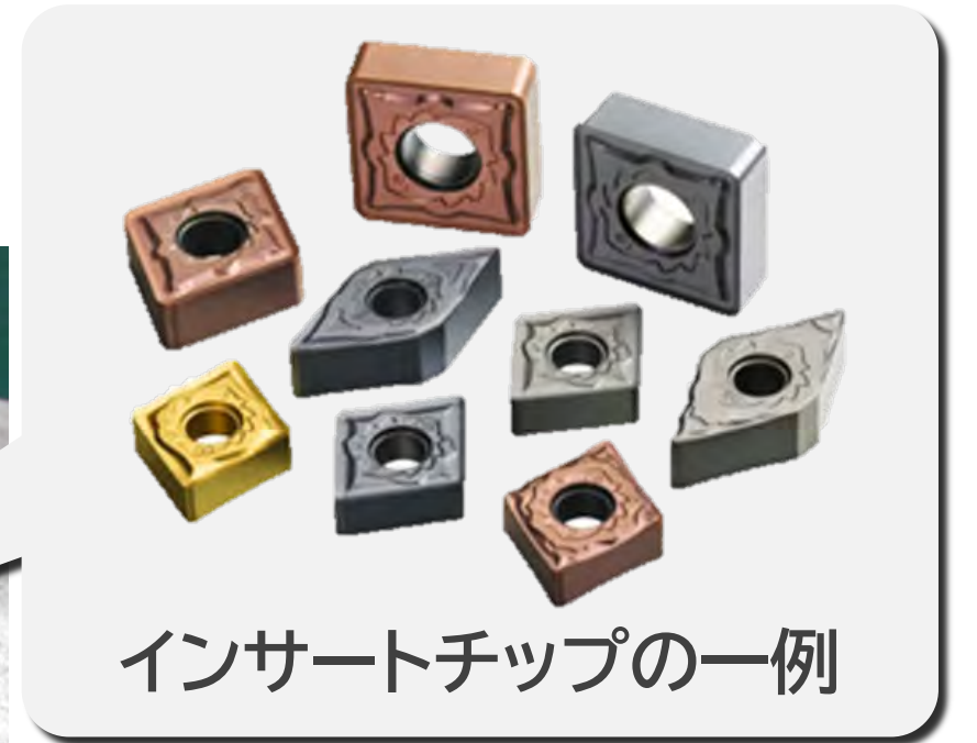
インサートチップの一例