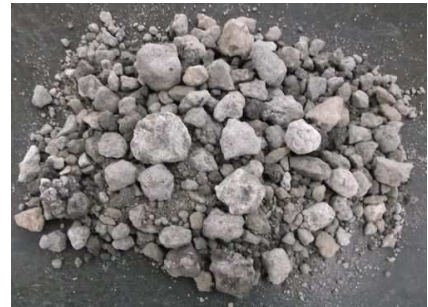
(再生クラッシャーラン)

また、フライアッシュを造粒固化した製品は、一般路盤材に比べて軽量のため、小型車でもより多く運べます。