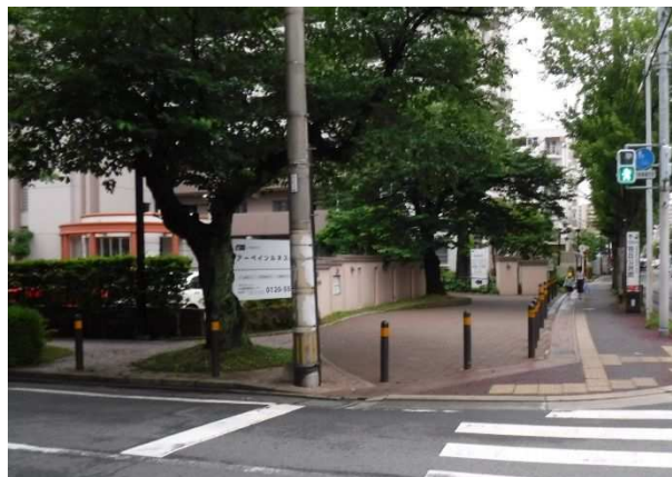
景観に配慮された製品

再生プラスチック類を使用した、耐候性のある製品です。環境問題に取り組んでいる多くの地域で使用されています。