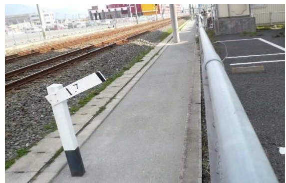
簡易舗装（防草対策）