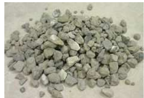
コンクリート塊から製造した再生骨材L

「再生骨材コンクリート」は、構造物の解体などにより発生したコンクリート塊を破砕等の処理を行って製造した再生骨材を、骨材として使用したコンクリートです。再生骨材コンクリートの製品規格として、JIS A 5023（再生骨材コンクリートL）が制定されており、擁壁の裏込めコンクリート、均しコンクリート等の高い強度や耐久性が要求されない部位では問題なく使用することができます。