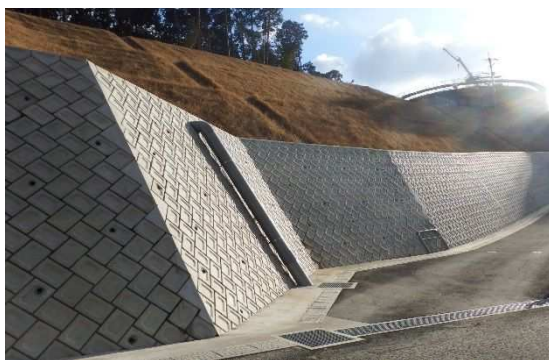
ブロック積の裏込めコンクリート