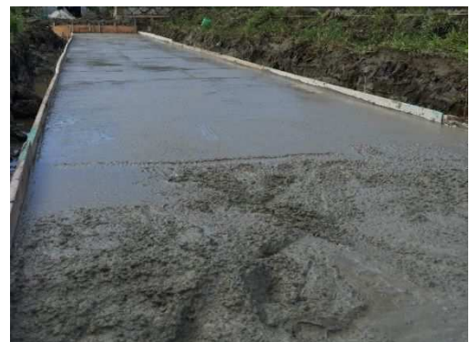
均しコンクリート