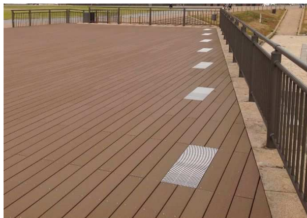
ウッドデッキで使用

「木材・プラスチック再生複合材」は、再・未利用木材と廃プラスチックからできた製品です。フェンス、デッキ、ベンチ等に使用されています。